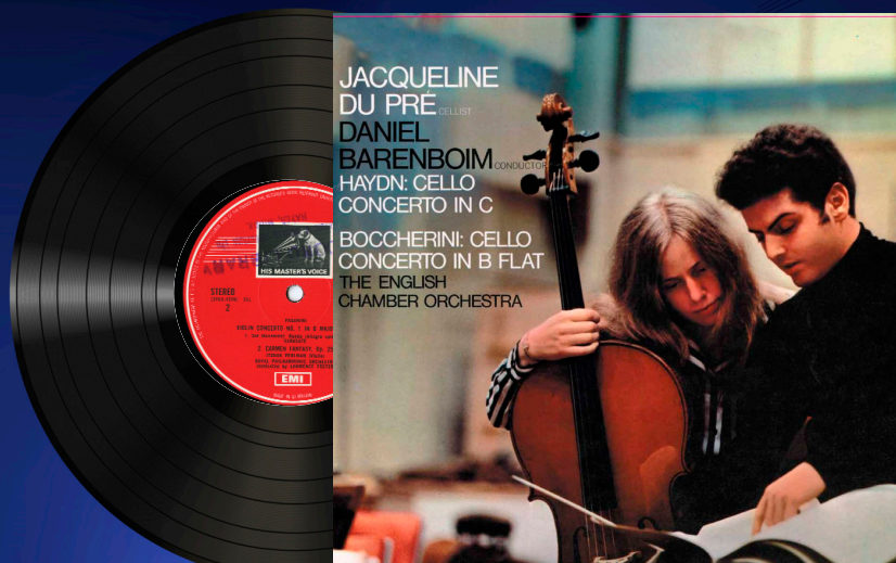
LP TVC 010 180gr audiophile remastering